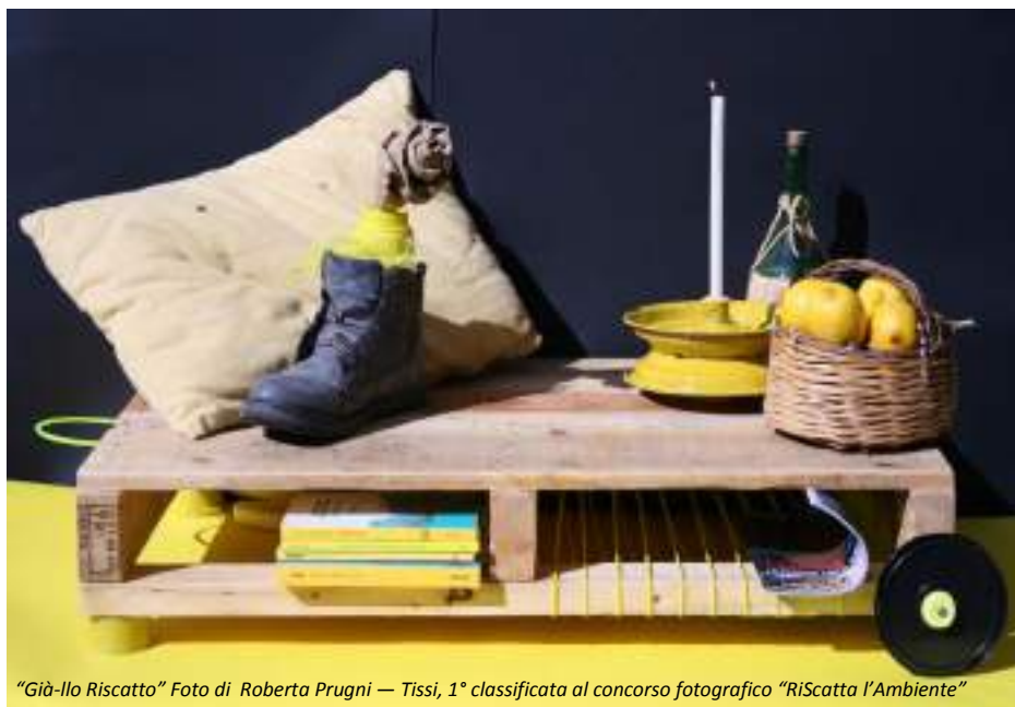
"Già-llo Riscatto" Foto di Roberta Prugni — Tissi, 1° classificata al concorso fotografico "RiScatta l'Ambiente"